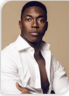
TIAGO BARBOSA ACTOR/CANTANTE/MODELO